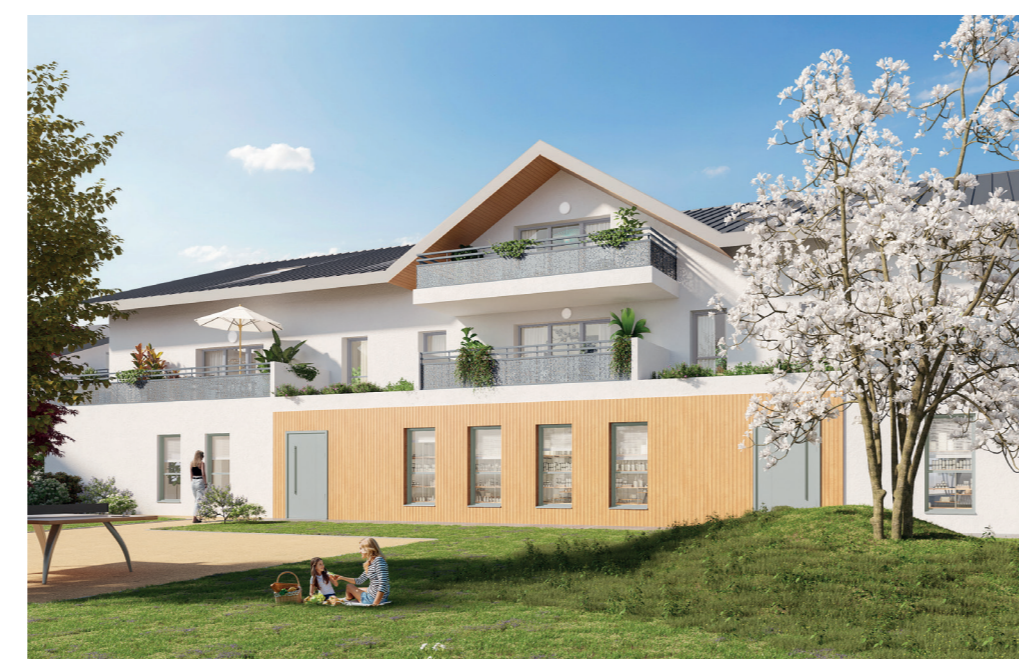
Les Jonquilles du Môle

Dans la continuité de son action au service de l'intérêt général, TERACTEM accompagne aujourd'hui de nombreuses collectivités dans la réalisation de leurs nouveaux quartiers. TERACTEM, réalisateur des territoires intelligents du 21 e siècle en Haute-Savoie.